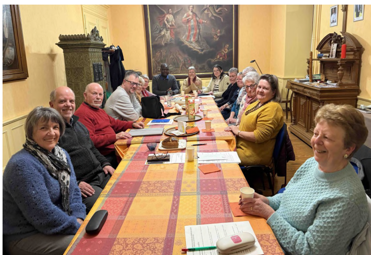
Équipe paroissiale de Marmoutier, le 20 mars